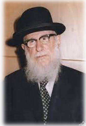
הרב חיים דוד הלוי זצ"ל