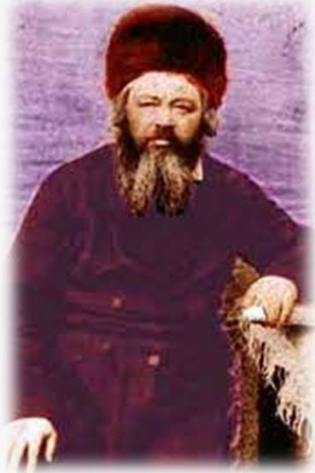
הרב יחיאל מיכל הלוי אפשטיין זצ"ל