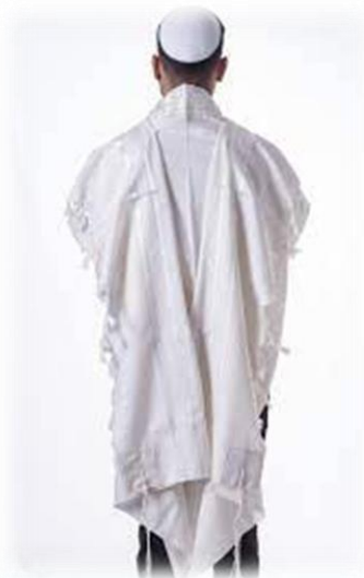
חתן מתעטף בטלית

הזמן בו מותר לנו לברך על לבישת ציצית או עטיפה בטלית הוא שעה זמנית לפני זריחת השמש ('נץ החמה') ועד הלילה ('צאת הכוכבים'). את השעות המדוייקות נוכל לבדוק בלוח המפרט את הזמנים המדוייקים.