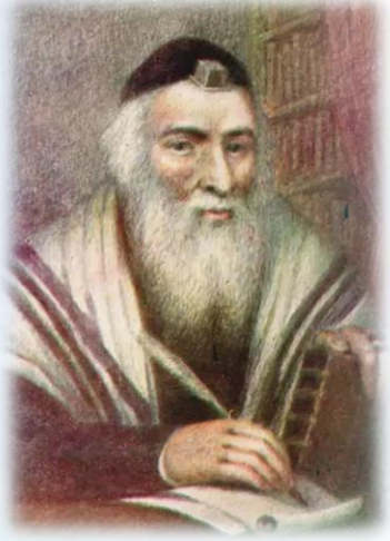
דיוקן המיוחס לרבי אליהו מוילנא