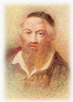
ציור דיוקנו של רבי משה איסרליש